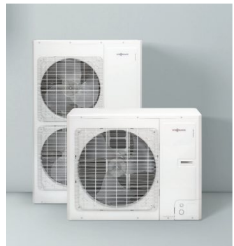
Vitocal 100-S Зовнішній блок

Регулятор Vitotronic 200 дозволяє ефективно використовувати тепловий насос не тільки в нових системах, а і при модернізації