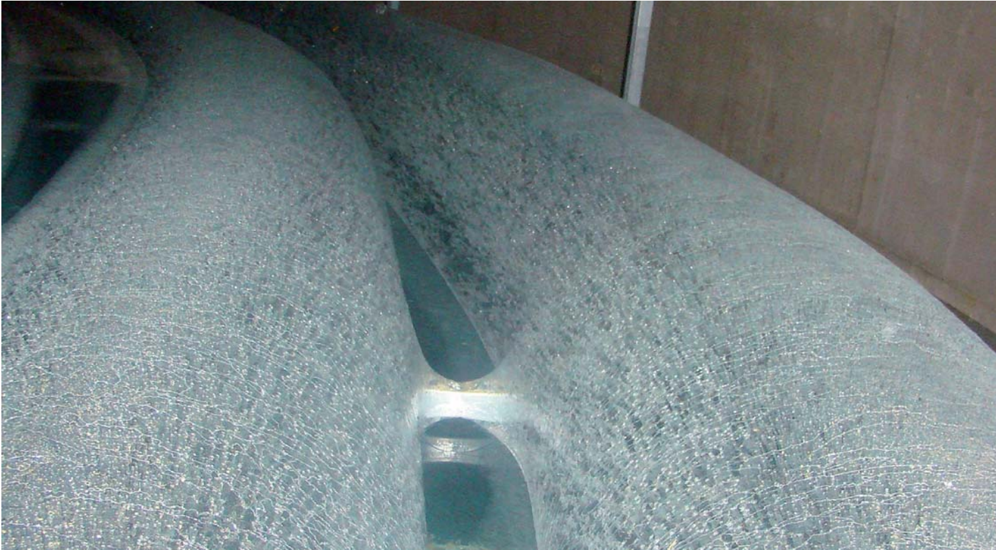
Eisbildung um den Wärmeübertrager im SolarEis-Speicher.

Im Sommer wird dagegen über die Oberfläche des Speichers Wärme an das Erdreich abgegeben. Somit stellt sich ein automatischer Regeleffekt ein, der eine Überhitzung des Speicherinhalts im Sommer verhindert.