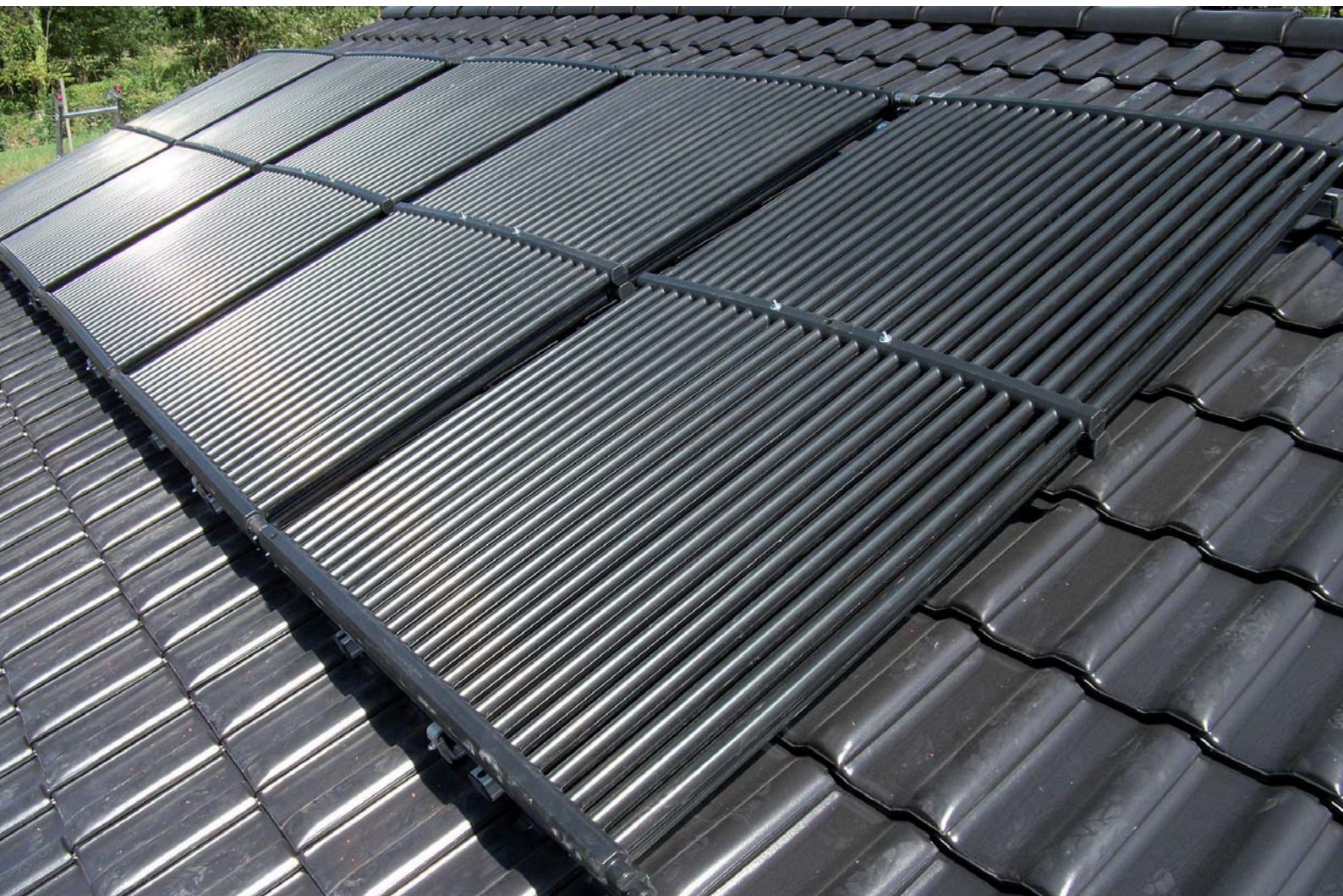
Solar-Luftabsorber für den Betrieb in Anlagen mit Eisspeicher und Wärmepumpe