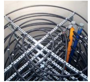
Entzugswärmetauscher im Eisspeicher

Am äußeren Rand des Behälters befindet sich der Regenerationswärmetauscher. Dieser Wärmetauscher führt die durch den Solar/Luftabsorber bereitgestellte Umweltenergie dem Speicher zu.