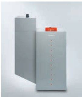
Vitoligno 300-P от 4 до 48 кВт