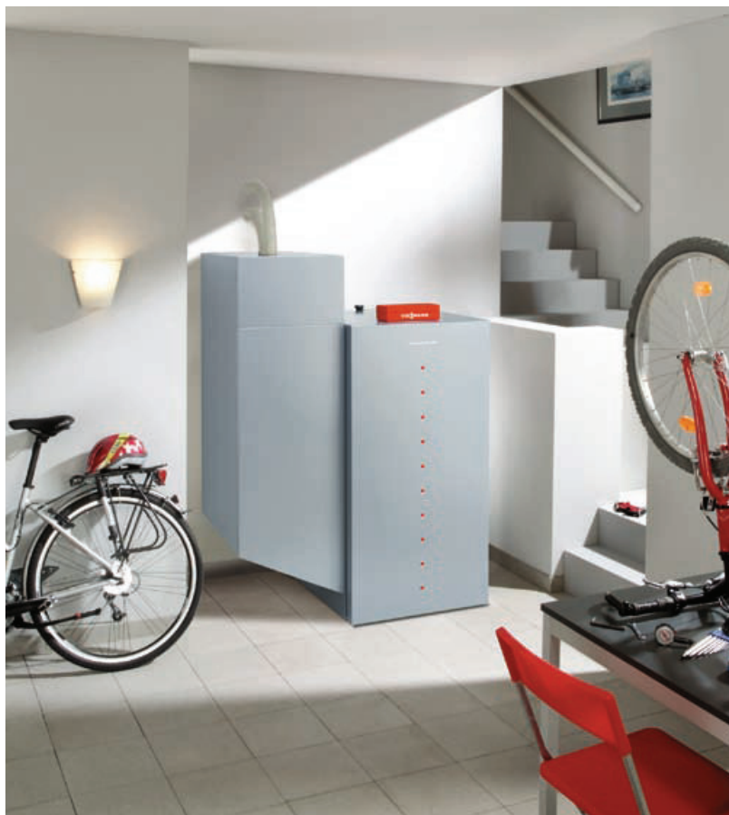
Vitotigno 300-P от 4 до 48 кВт