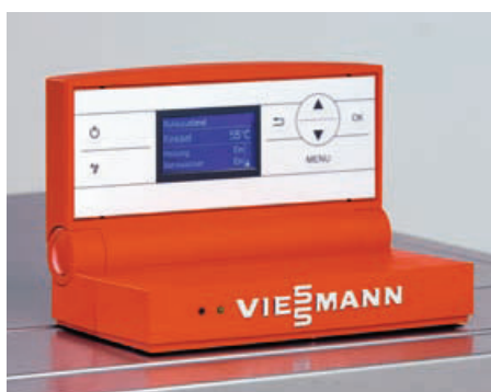
Система управления Vitotronic – большой полнотекстовый дисплей