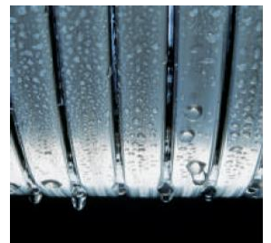
Високоякісний теплообмінник з нержавіючої сталі Inox-Radial

Інтуїтивна панель керування дозволяє швидко налаштувати температуру для опалення та гарячого водопостачання. Цифровий дисплей відображає поточний стан роботи та температуру. Як опція, поставляються системи віддаленого керування – через кабель або радіозв'язок.