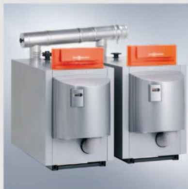
Котли Vitocrossal 200 потужністю від 87 до 628 кВт, та 2512 кВт в каскаді