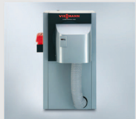
Vitocrossal 200 потужністю від 404 до 628 кВт