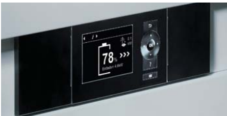
Das Display zeigt stets den aktuellen Lade- und Betriebszustand von Vitocharge an.

Die Gesamtmenge des selbst erzeugten Stroms ergibt sich aus der Photovoltaik-Anlage und dem KWK-Gerät. Er wird unmittelbar im Haus verbraucht. Vitocharge speichert überschüssigen Strom und stellt ihn bei Bedarf zur Verfügung.