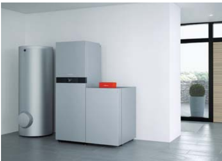
Regeneratives Energiesystem mit Photovoltaik-Anlage Vitovolt, Wärmepumpe Vitocal und Stromspeicher-System Vitocharge für eine hohe Unabhängigkeit vom öffentlichen Stromversorger

Die Gesamtmenge des selbst erzeugten Stroms ergibt sich aus der Photovoltaik-Anlage und dem KWK-Gerät. Er wird unmittelbar im Haus verbraucht. Vitocharge speichert überschüssigen Strom und stellt ihn bei Bedarf zur Verfügung.