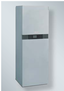
Vitocharge hat eine Speicherkapazität von maximal 18,6 kWh.