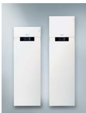
Vitocal 333-G (ліворуч) Vitocal 343-G (праворуч)