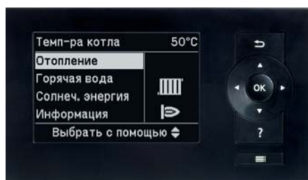
Графічний дисплей нової системи управління Vitotronic відображає режими спільного управління тепловим насосом та сонячним колектором.