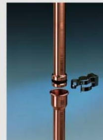
Швидкороз'ємні гідравлічні з'єднання Multi-Stecksystem