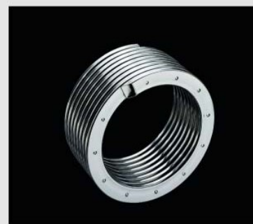
Теплообмінник із нержавіючої сталі Inox Radial