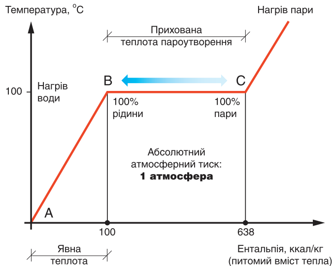
Рис. 1: Залежність температури від ентальпії води при пароутворенні/конденсації

У теплотехніці існує поняття верхньої та нижньої теплотворної спроможності газу. Їх показники відрізняються між собою саме на це значення додаткового тепла